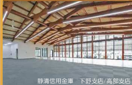
静岡信用金庫 下野支店/高部支店