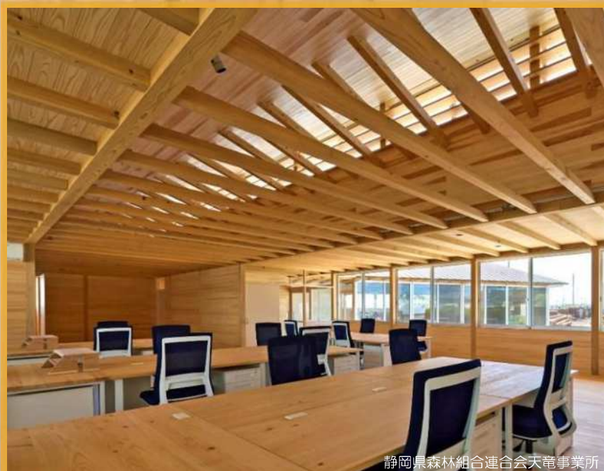
静岡県森林組合連合会天竜事業所