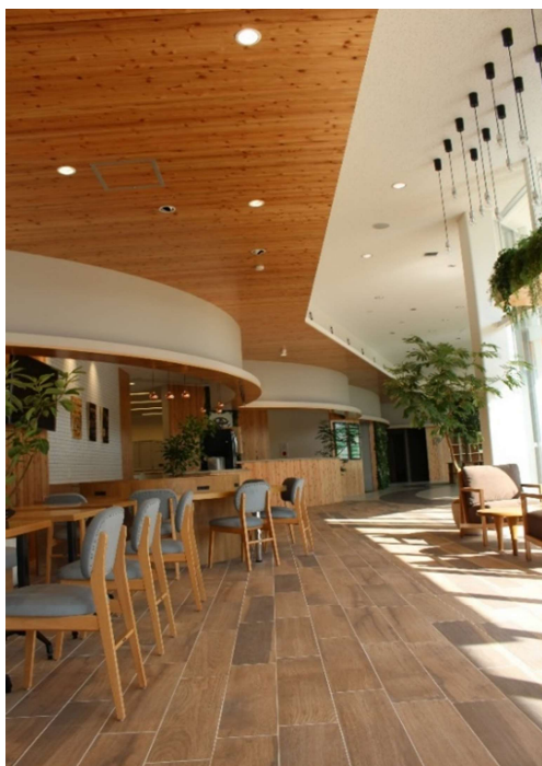
カフェ・スペースと天井スギ羽目板