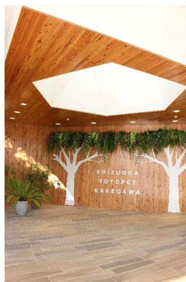
暖かみのあるエントランス