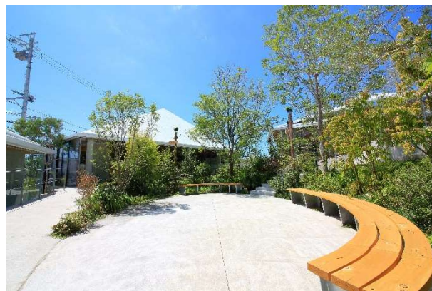
セントラルガーデンと住まいラボ(中央)