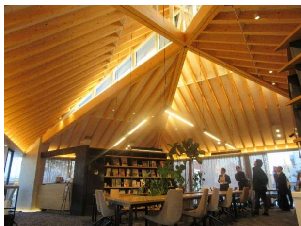
学びの場・住まいラボ