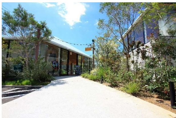
ウェルカムホール(左)と食ラボ(右)