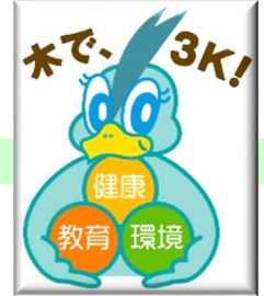
【シンボルキャラクター・もっくん】

また、木材に関する消費者の皆様方からのご相談に応じるとともに、様々な PR 活動を通して、木材の良さを幅広く知っていただくよう努めております。