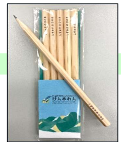
【最新 PR グッズ・ひのき鉛筆】