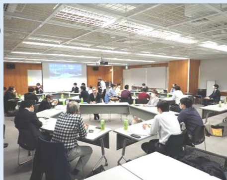
昨年度のフォローアップ講座の様子