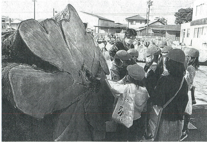
木材の説明を受ける児童たち＝島田市御請のスンエン