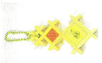
県産ヒノキなどを製作した「ゆらゆらチャーム」

県木材協同組合連合会は県産材PRの一環で、バッグなどに付けられるミニ小物を製作した。希望者約500人に配布する。締め切りは2月15日(必着)。「ゆらゆらチャーム」と題した小物は縦約6センチ、横約4センチ、厚さ8ミリ。県産ヒノキなどを格子状に組み、同会シンボルキャラクター