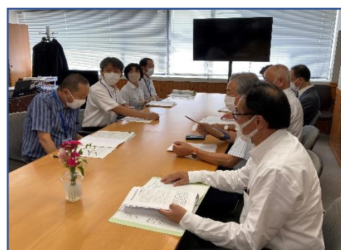
経済産業部での意見交換