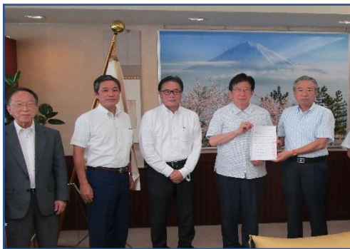
中谷県森連会長から 川勝知事へ要請書を手交