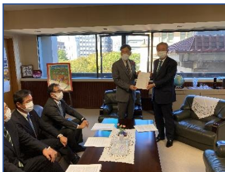
中谷県森連会長から 難波副知事へ要請書を手交