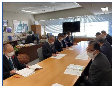
経済産業部での意見交換