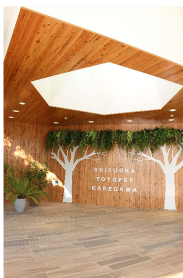
暖かみのあるエントランス